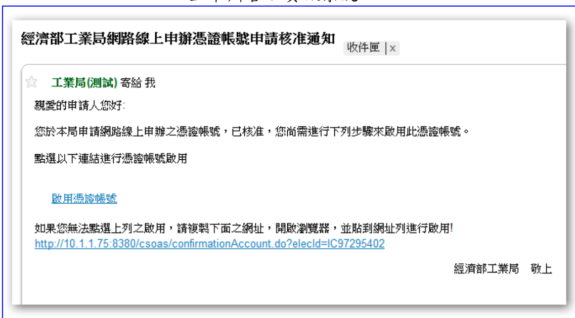
【圖表 4】帳號啟動電子郵件