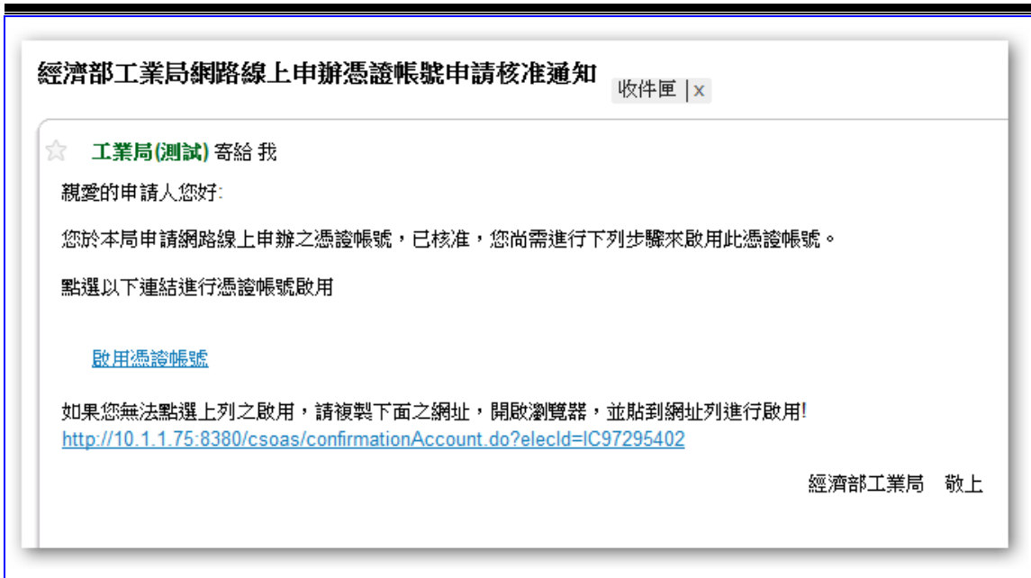
【圖表 2】帳號啟動電子郵件